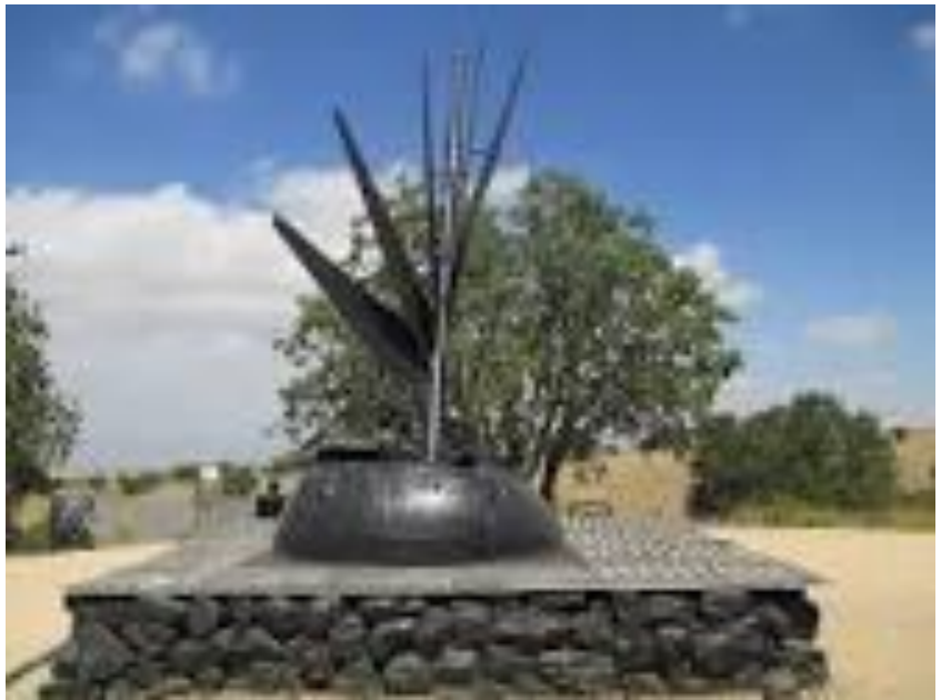
האנדרטה לחללי חטיבה 679