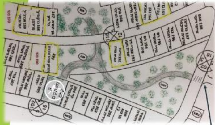
שכונת החרמון, שביל ליד הפחים