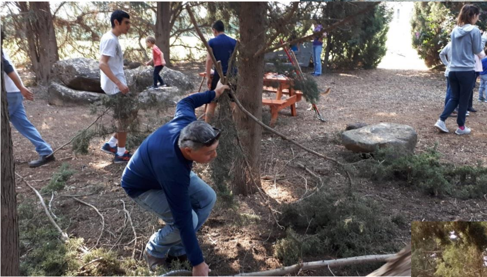
פרויקט טיפוח הגן היפני ע"י מערכת החינוך החברתי